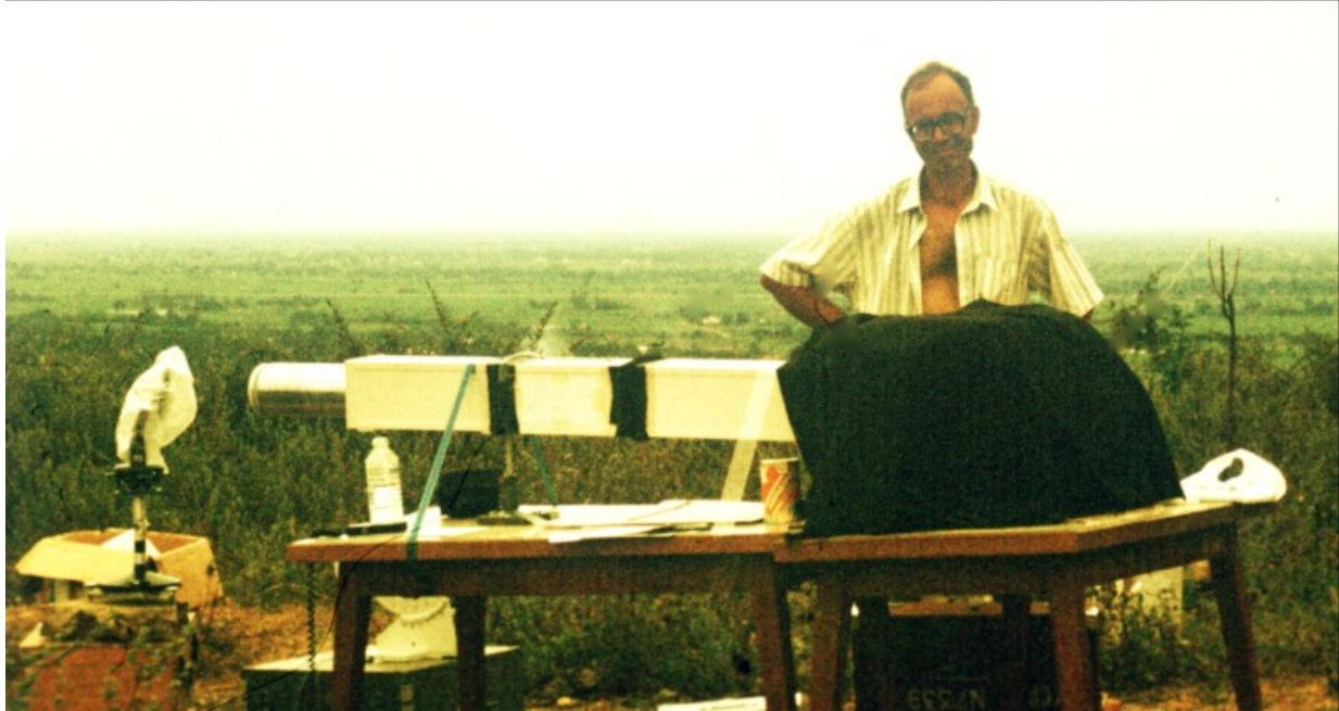
Обгоревший и довольный